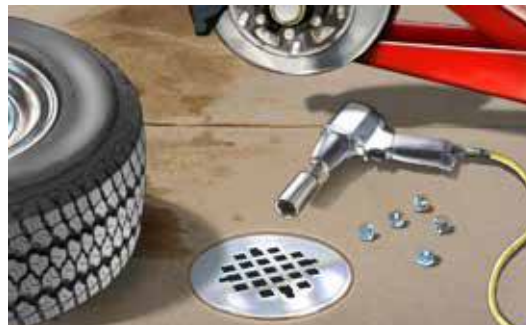
Cống Nước Thải Sinh Hoạt: Cống trong nhà chảy đến nhà máy xử lý chất thải.