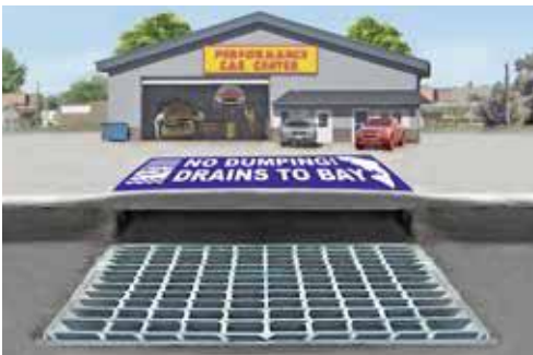
Cống Thoát Nước Mưa: Cống ngoài trời chảy trực tiếp vào các nhánh sông và Vịnh.

Nếu cửa hiệu của quý vị có ống thoát theo tầng, vui lòng liên hệ cơ quan xử lý nước thải địa phương để biết yêu cầu về việc xả vào cống nước thải.