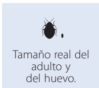
Tamaño real del adulto y del huevo.

Las chinches son insectos pequeños y planos que se esconden en espacios reducidos como las costuras de los colchones y las grietas de los muebles. Tiene un color parecido al de las semillas de las manzanas, pero son un poco más pequeñas. Las chinches jóvenes al principio son aproximadamente del tamaño de una semilla de amapola. Nos pican mientras estamos dormidos o descansando.