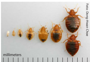
Las chinches salen de los huevos (a la izquierda) y se convierten en adultos (a la derecha).

Rociar productos ecológicos directamente sobre las chinches es efectivo, pero el uso de los insecticidas por sí solo no puede eliminar una infestación de chinches. Las "bombas para insectos" de venta libre no son efectivas y pueden hacer que las chinches se propaguen a otras habitaciones de su hogar o a los departamentos de los vecinos.